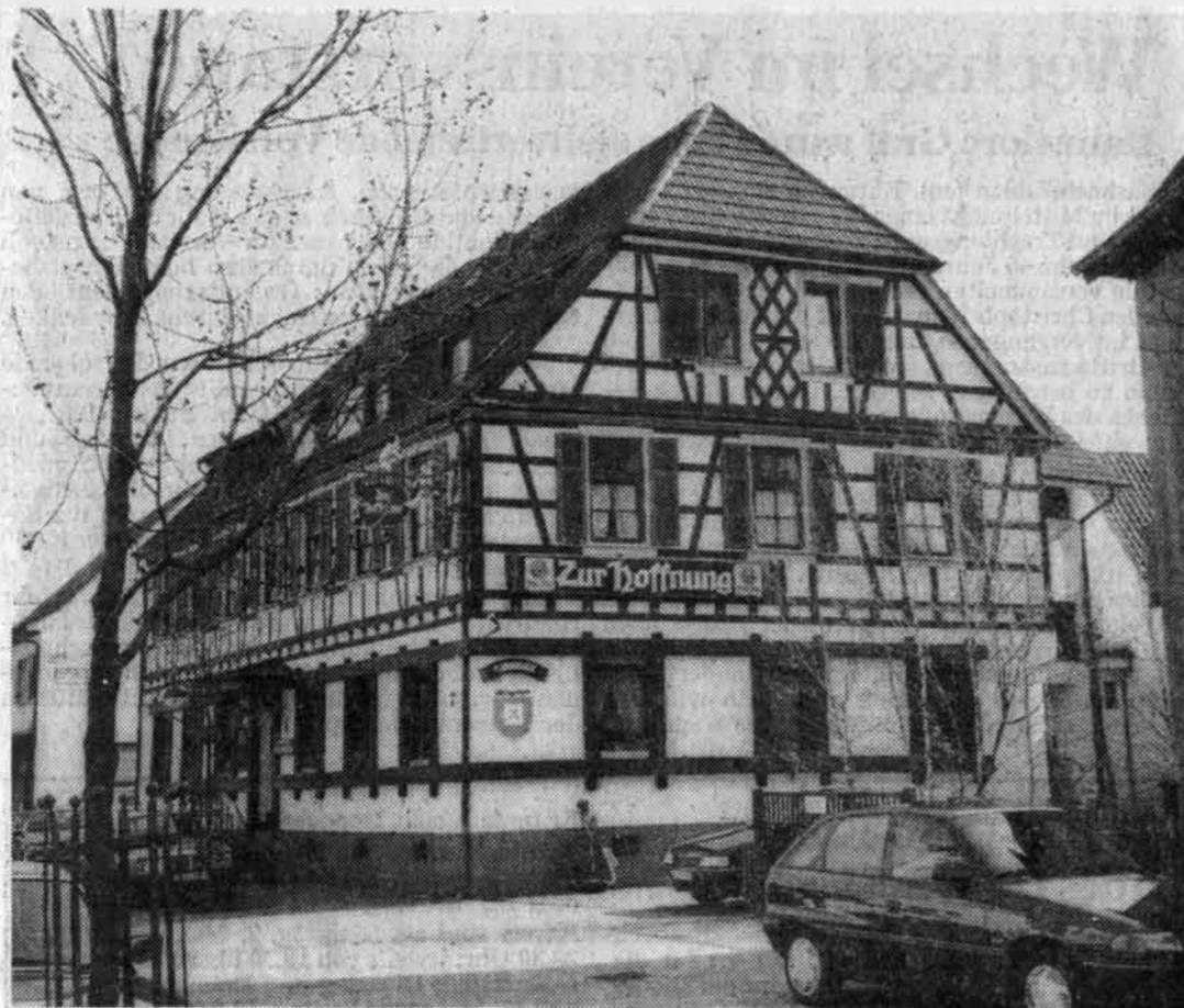
EIN TREFFPUNKT für Acherner Demokraten war in der Revolution das damalige Gasthaus „Zur Republik“, das später in „Zur Hoffnung“ umbenannt wurde.

Ein historisches Jubiläum gilt es in den kommenden Jahren gebührend zu feiern: Die deutsche Revolution von 1848/49 wird 150 Jahre alt.